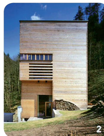
2. Il sistema BlockBau applicato all'architettura contemporanea.

www.abitazioniecologiche.it info@abitazioniecologiche.it