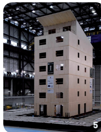
5. Prove su tavola vibrante 3D full-scale su edificio di 7 piani.